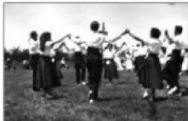
Concurs de Colles Sardanistes a Cardedeu any 1954

"50 ANYS DE CONCURSOS DE COLLES SARDANISTES A CARDEDEU"