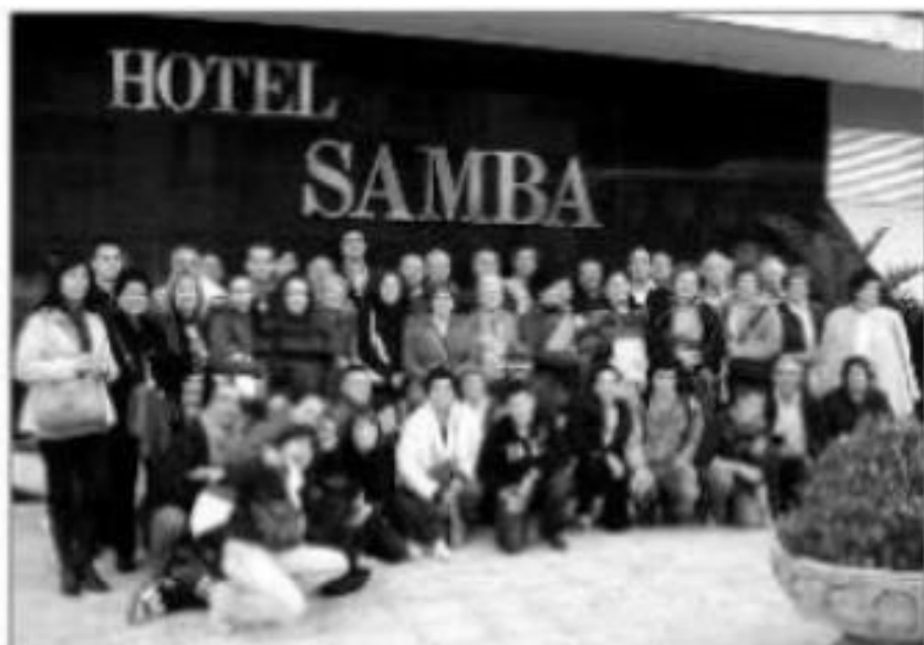
Expedició dels membres del Pessebre Vivent de Martorelles

Emorzar a les 8.30 h. Matí lliure per visitar Llorat de Mar. Dinar a l'Hotel a les 13.30 h. Sortida de Llorat a les 17 h. Arribada a Martorelles a les 19 h.