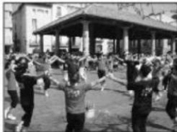
61è Concurs de Colles Sardanistes, el 22 març 2008