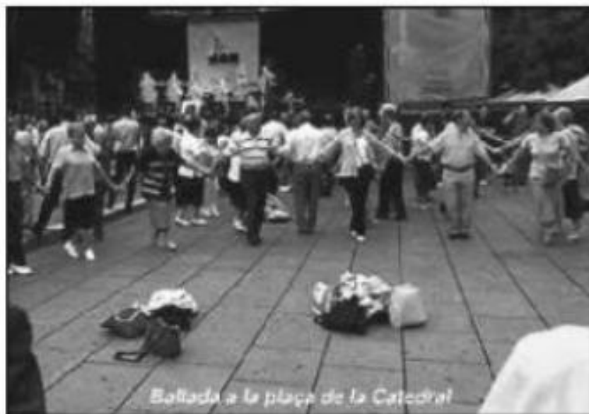
Ballada a la plaça de la Catedral

Ja per acabar només dir que les sardanes s'estan perdent, senyors! D'aquí un temps només ens quedarà la Catedral i crec que la dansa típica de Catalunya bé és mereix un esforç. Què passarà quan això es perdi? Qui serà el culpable? Els sardanistes? La gent que no és mou? La poca promoció? No tinc les respostes però crec que entre tots junts hauríem de pensar quin és el futur que volem per la nostra dansa.