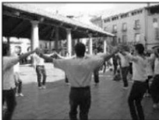
38è Festival Sardanista, el dia 25 d'octubre de 2009