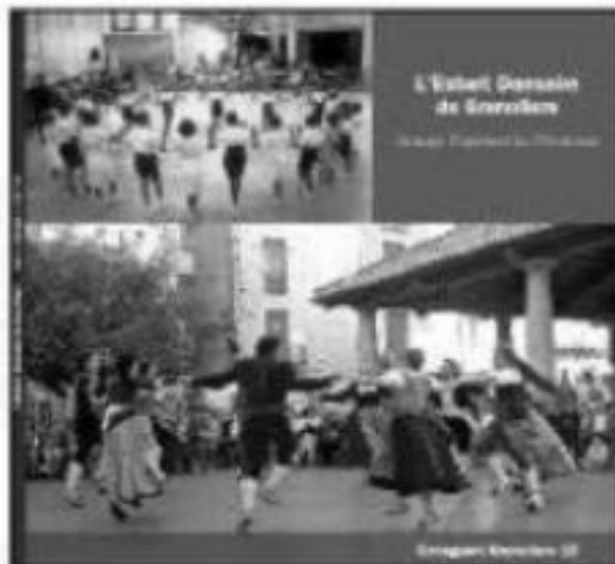
L'Esbart Dansaire de Granollers