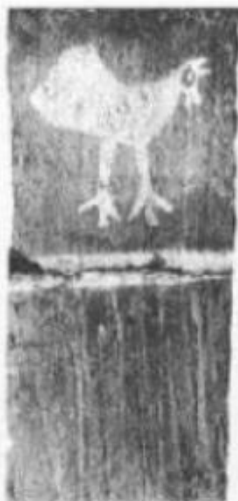
Sèrie de "bitaques" pintades del segle XVIII provenint d'una casa del veïnat de Castell Rosselló a costat de Perpinyà. Són "cairats", les mides dels quals són de 40x22 cm. Aquestes dimensions són molt contents dins la construcció a Catalunya del Nord (cal Casa Pallat)